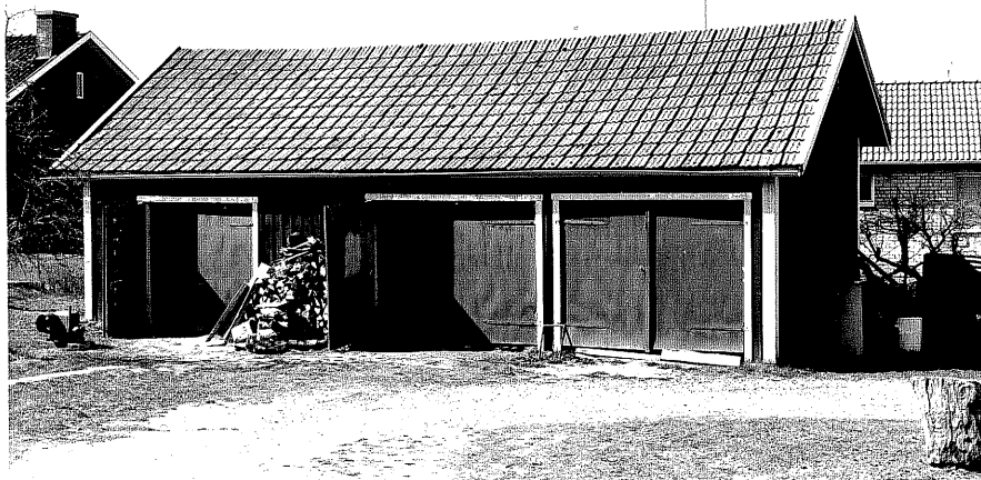
Uthus b fr.50, 12:7.