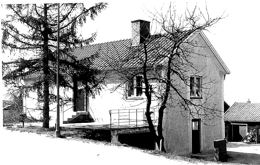
Bostadshus a fr.50, 12:8.

Ödeshög sn Rosen 6 Storgatan 40 foto:M.Wikdahl,1978.