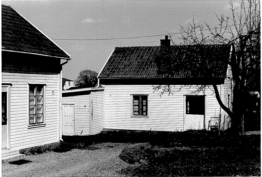
Uthus c fr.SV, 12:5.

Ödeshög sn Rosen 7 Storgatan 38 foto:M.Wikdahl,1978.