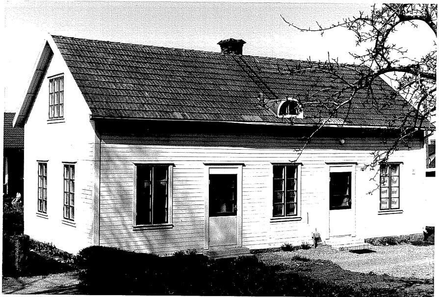
Bostadshus b fr.SV, 12:4.