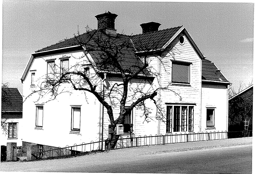
Bostadshus a fr.SV, 12:6.

Ödeshög sn Rosen 7 Storgatan 38 foto:M.Wikdahl,1978.