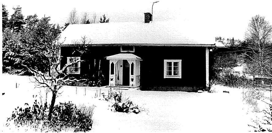
Neg. nr. T 12:12 Södra huset från S