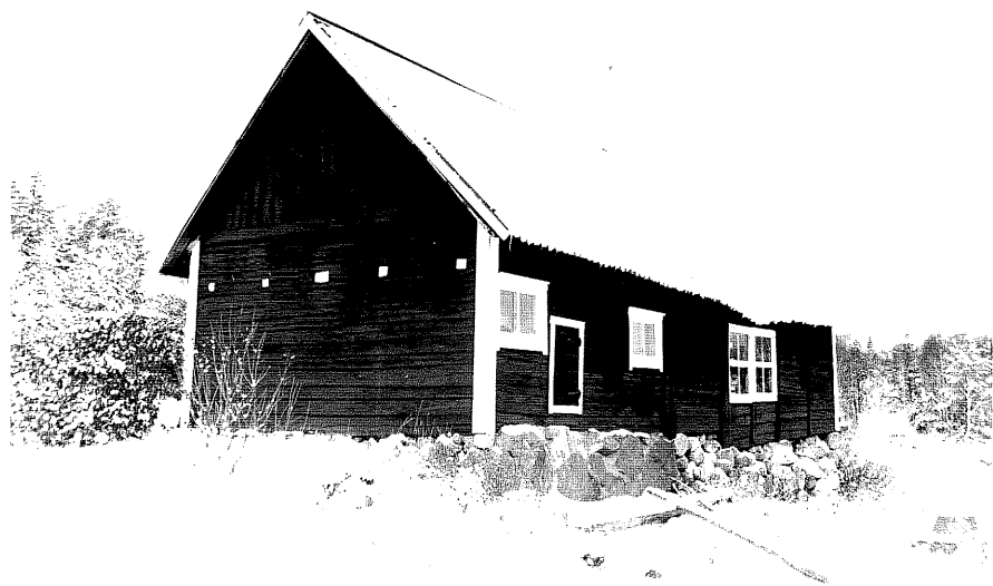
Neg. nr. T 12:13 Ladugård från SO