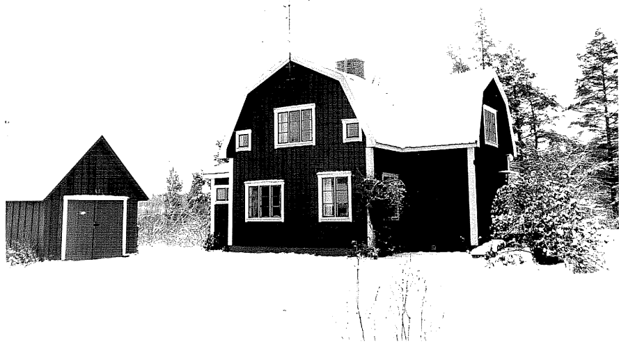
Neg. nr. T 12:14 Bostadshuset från NV