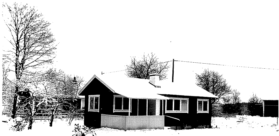
Neg. nr. T 12:15 Gäststuga från SV