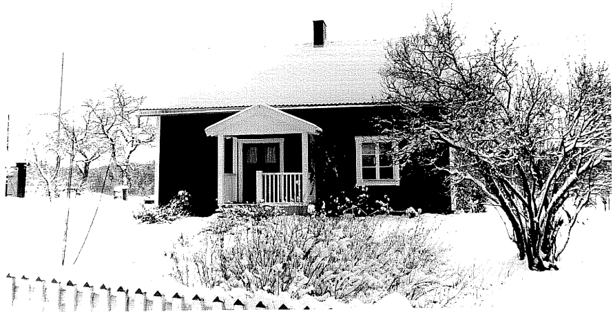
Neg. nr. T 12:17 Bostadshuset från SV