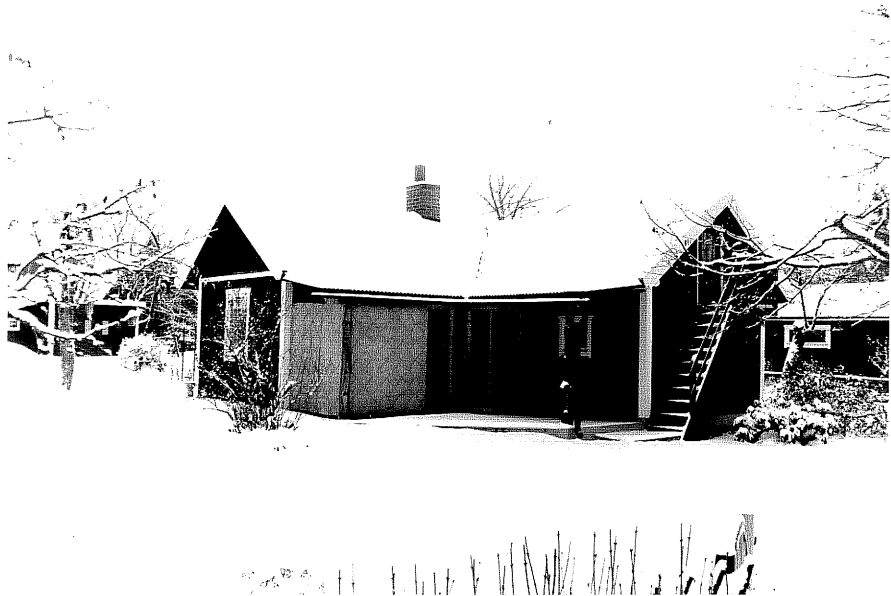
Neg. nr. T 12:16 Gäststuga från SV, Rottnåsa 1:8