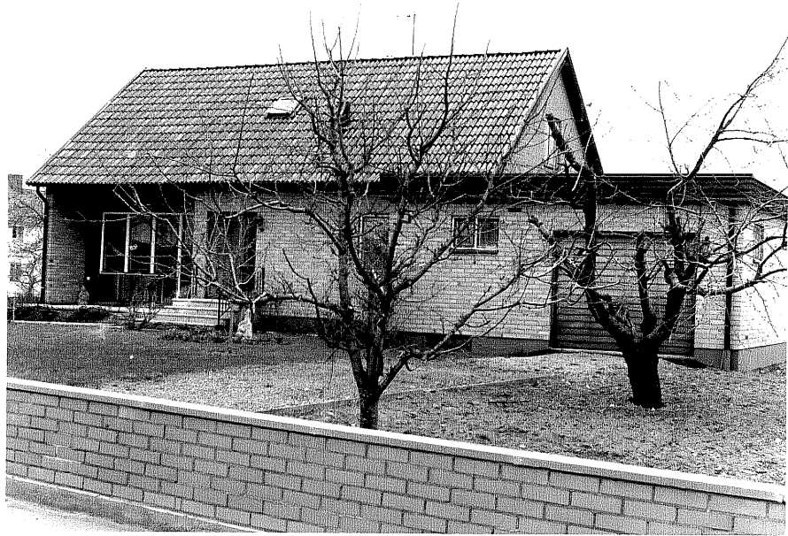
Bostadshus fr.S, 7:19.

Ödeshög sn Rudan 7 Hemgårdsgatan 8 1978.