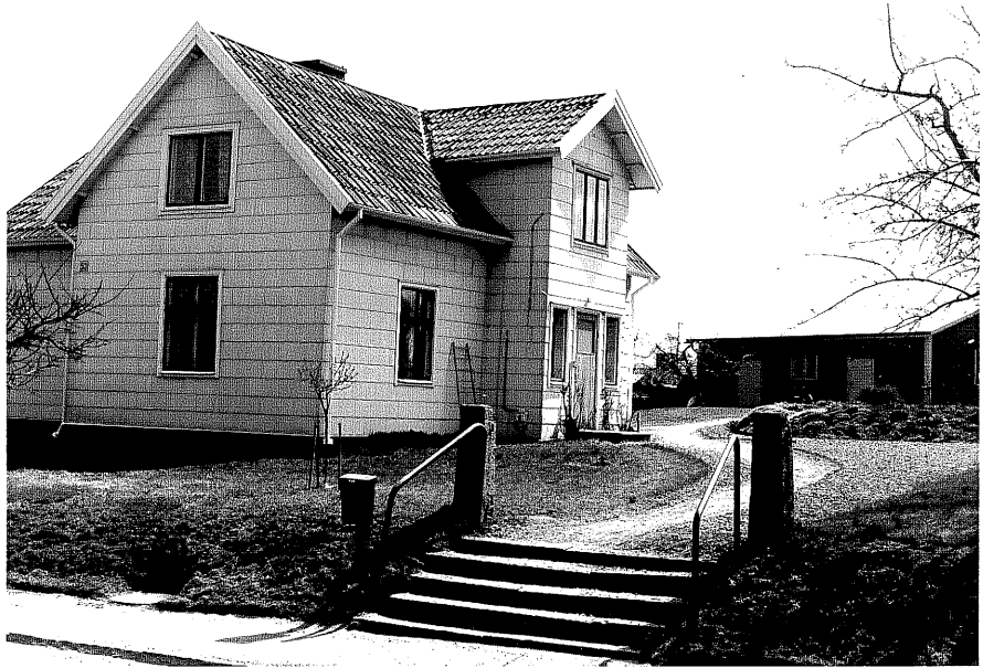
Bostadshus a fr.NV, 12:0.

Ödeshög sn Ryttaren 2 Storgatan 53 foto:M.Wikdahl,1978.