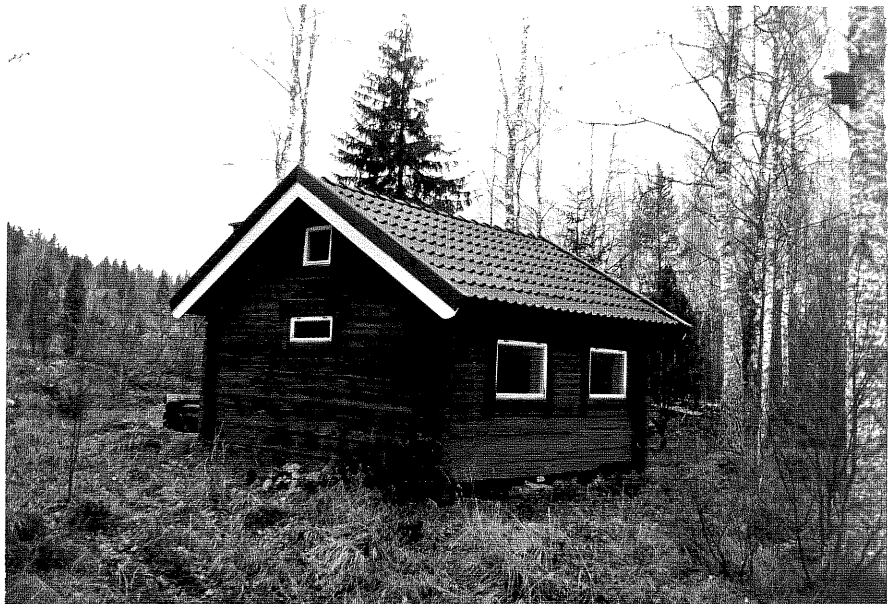
Neg nr T 07:20 Byggnad B från S