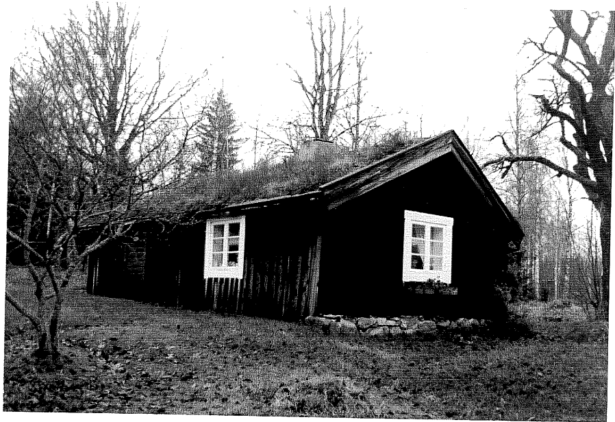
Neg nr T 07:18 Byggnad A från N

Ödeshögs kommun Trehörna socken Rödje 1:1 Sommarstuga vid Svenstorp