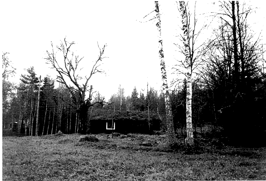
Neg nr T 07:21 Byggnad A i miljön från SV

Ödeshögs kommun Trehörna socken Rödje 1:1 Sommarstuga vid Svenstorp