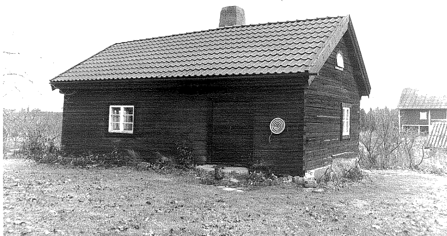
Neg. nr. T 14:11 Flygelbyggnad från SV