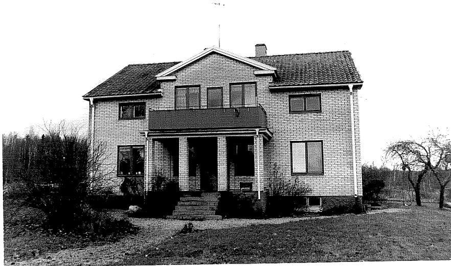
Neg. nr. T 14:13 Manbyggnaden från SO

Ödeshögs kommun Trehörna socken Rödje 1:1 Rödje