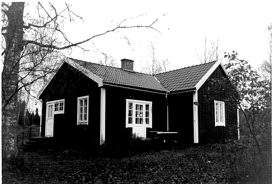
Neg nr T 07:22 Byggnad A från SÖ