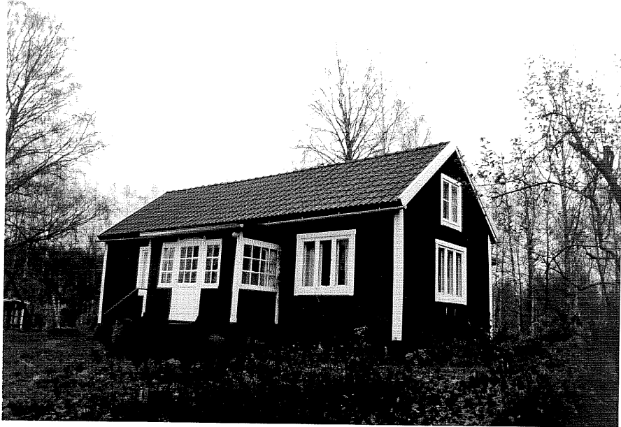
Neg nr T 07:24 Byggnad A från NV

Ödeshögs kommun Trehörna socken Rödje 1:5 Svenstorp