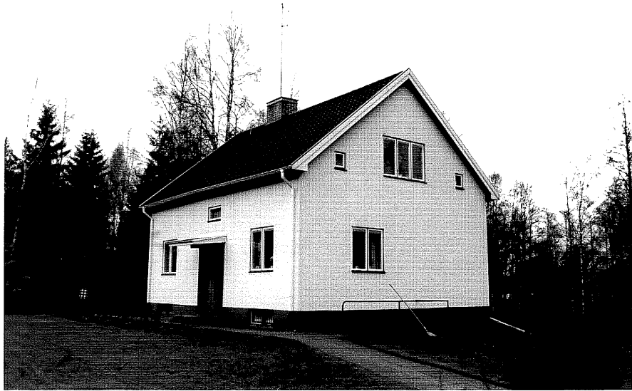
Neg. nr. T 07:17 Bostadshus från SV

Ödeshögs kommun Trehörna socken Rödje 1:7