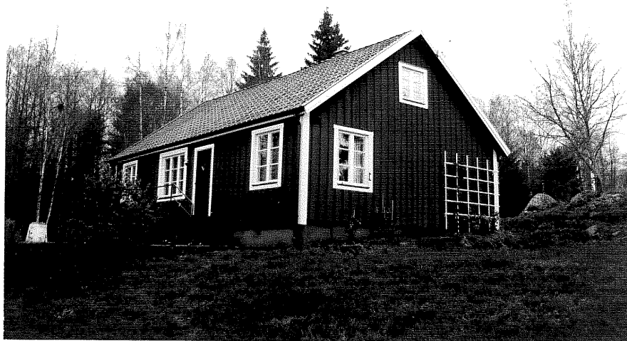
Neg nr T 07:28 Bostadshuset från NO