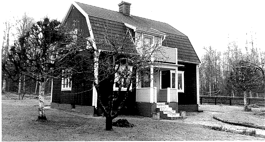
Neg. nr. T 14:10 Boningshuset från NV

Ödeshögs kommun Trehörna socken Rödje 2:1 Haga