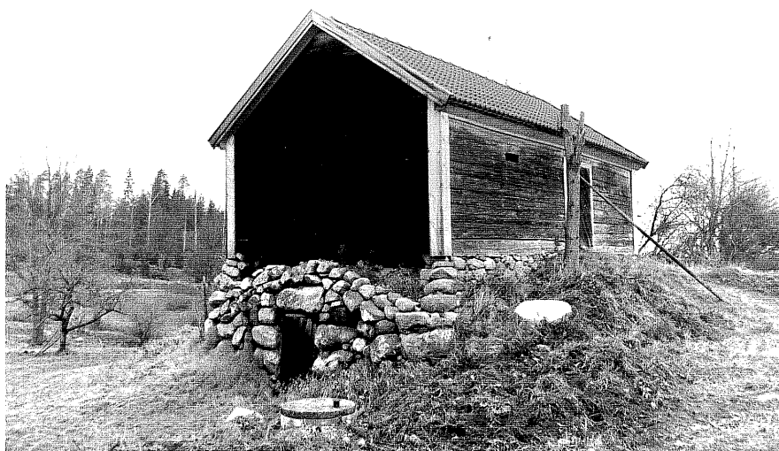
Neg. nr. T 14:08 Källarbod från S