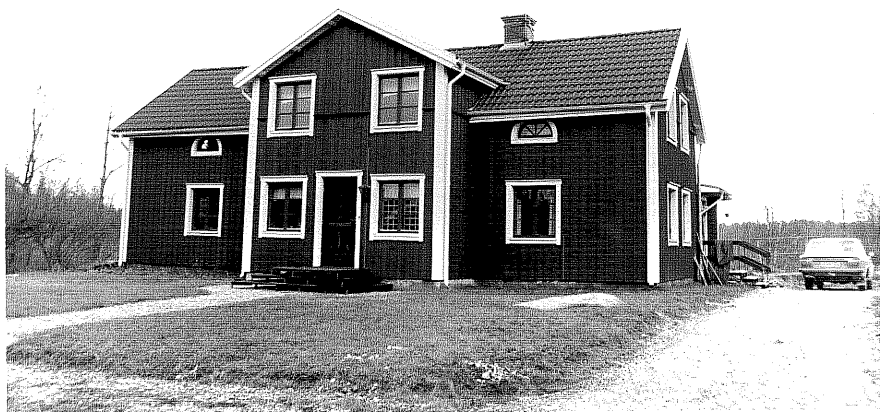
Neg. nr. T 14:07 Manbyggnaden från S