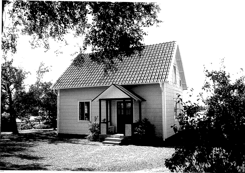
Neg. nr. V.T 06:17 Bostadshuset mot öster

Ödeshögs kommun V:a Tollstad socken Sjöhaga 1 1