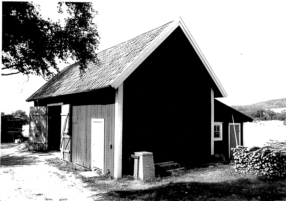
Neg. nr. V.T 06:18 Ladugård mot sydost