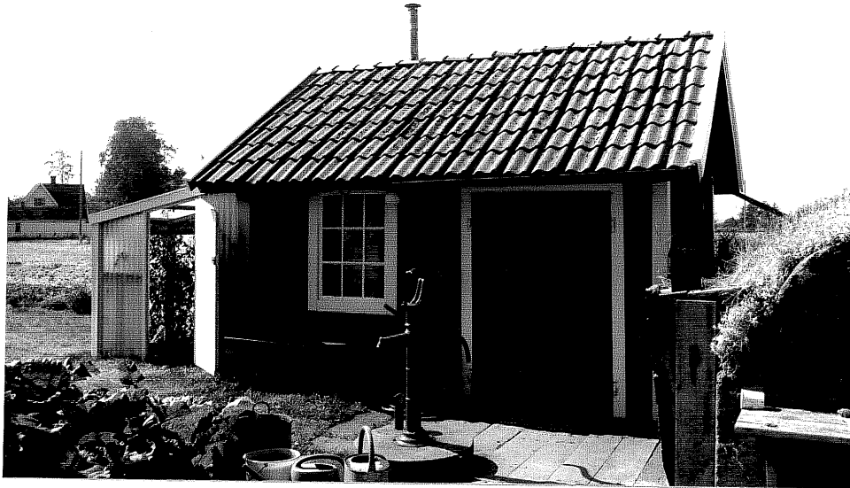
Neg. nr. V.T 06:19 Uthus mot öster