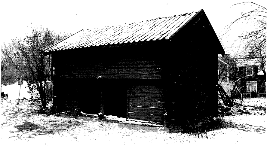
Neg. nr. T 09:28 Dubbelbod med utkragning från NV