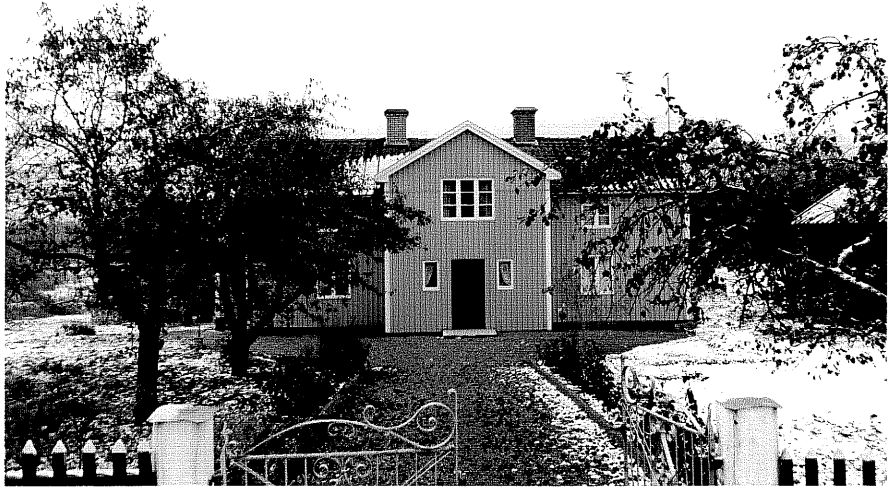
Neg. nr. T 09:27 Manbyggnaden från V

Ödeshögs kommun Trehörna socken Skruvhult 1:2 Mellangården