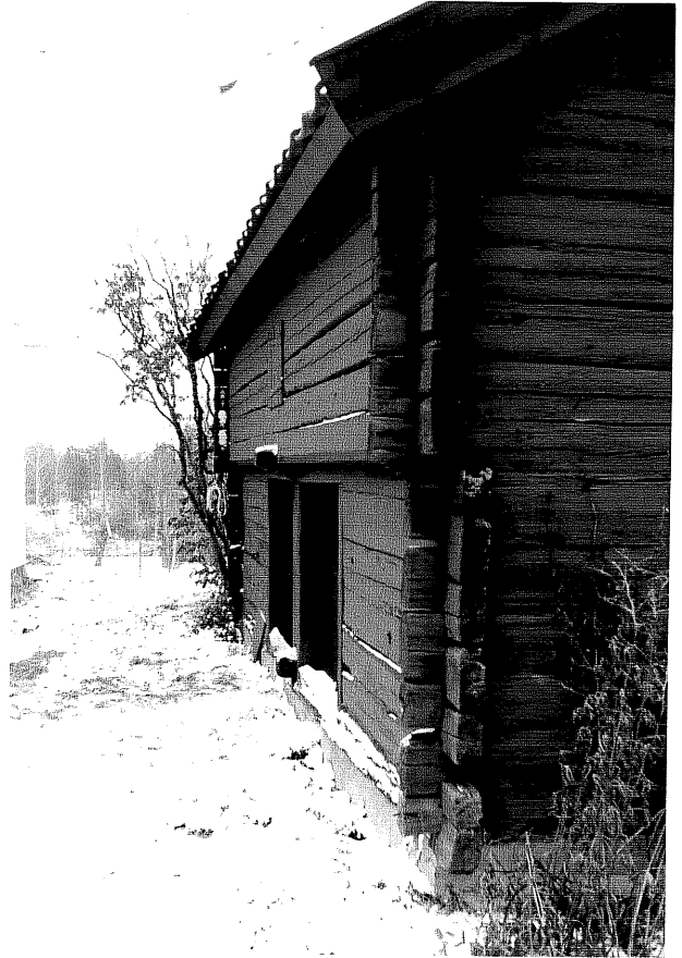
Neg. nr T 09:29 Detalj av boden