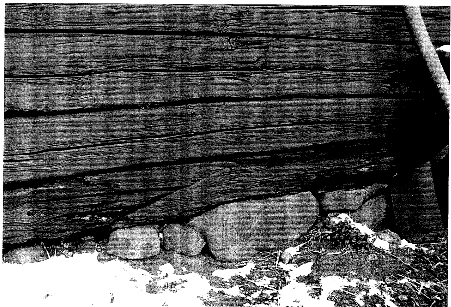
Neg. nr. T 09:36 Lask på ladugårdens bottensyll