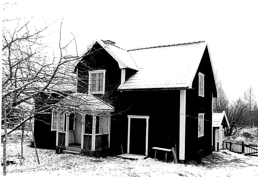
Neg. nr. T 09:24 Södra flygeln från NV