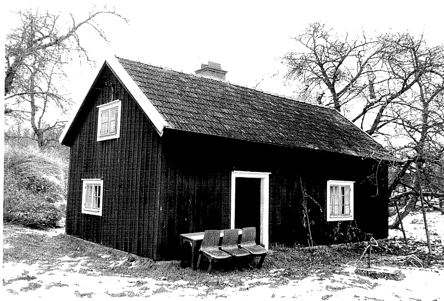
Neg. nr. T 09:23 Norra flygeln från SV