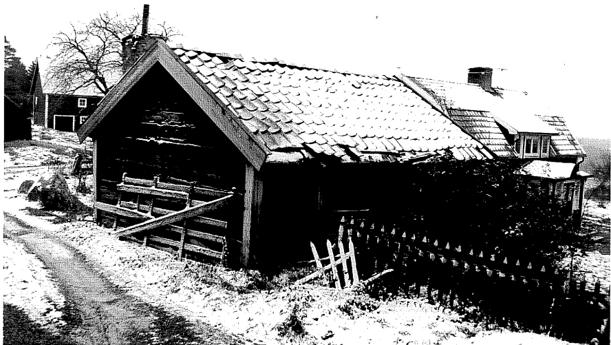
Neg. nr. T 09:37