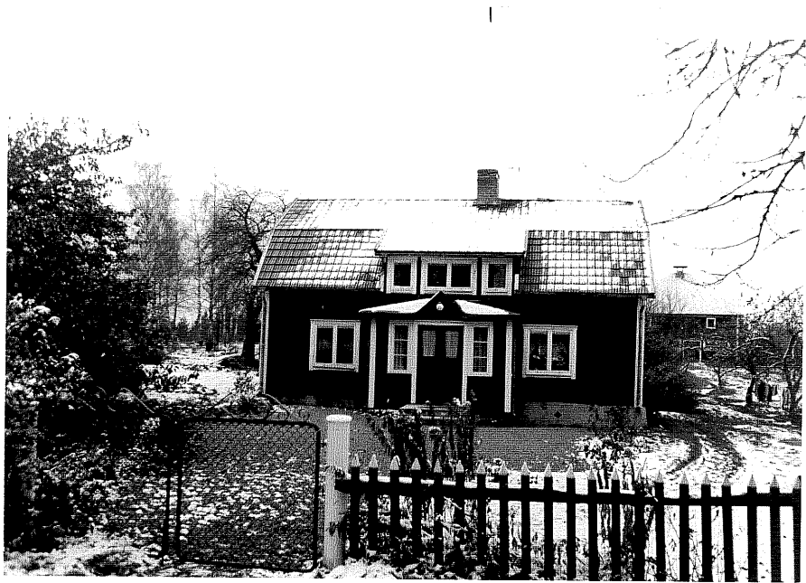
Neg. nr. T 10:01 Bostadshuset från V

Ödeshögs kommun Trehörna socken Skruvhult Norrgård 1:5