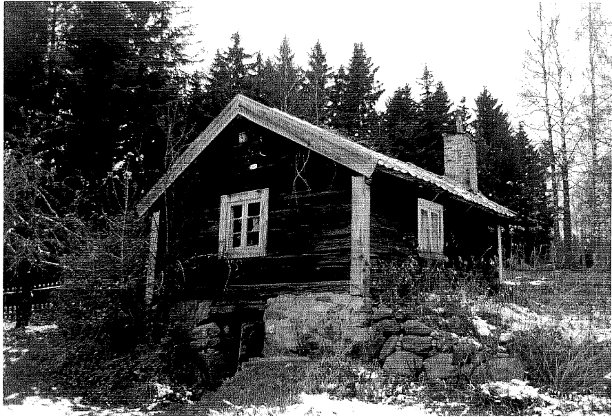
Neg. nr. T 10:03