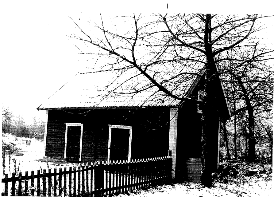
Neg. nr. T 09:38 Flygelbod från NV