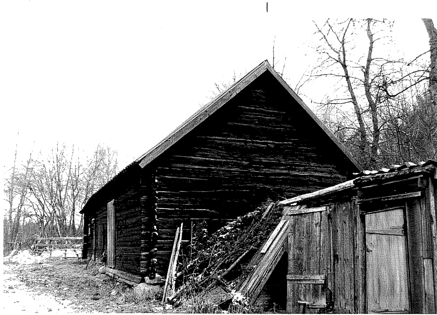
Neg. nr. T 09:12 Ladugården från 0