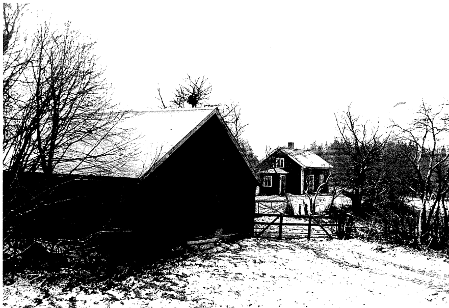
Neg. nr. T 09:15 Miljö från NV

Ödeshögs kommun Trehörna socken Skruvhult Stenbron. F.d soldattorp