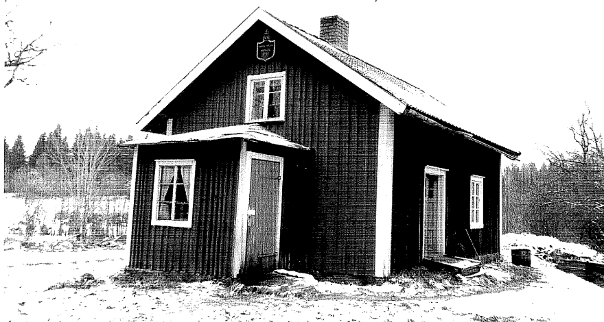
Neg. nr. T 09:11 Bostadshuset från N