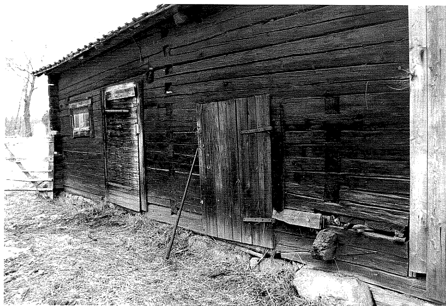
Neg. nr. T 09:13 Ladugården från S0