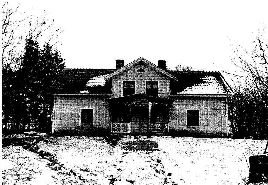
Neg. nr. T 09:20 Bostdshuset från V

Ödeshögs kommun Trehörna socken Skruvhult 2:5 3:1 Sörgården