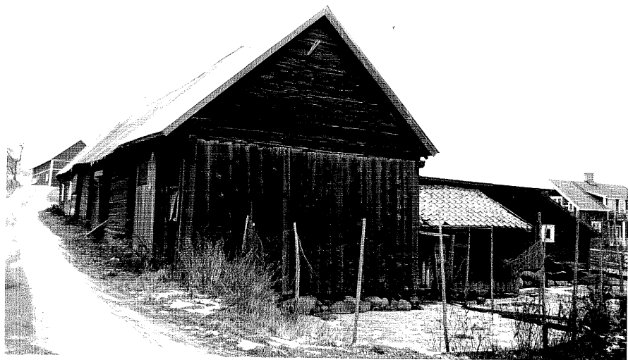
Neg. nr. T 09:35 Ladugårdens södra del från S