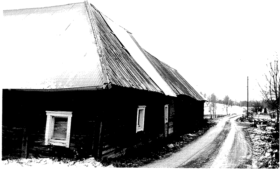
Neg. nr. T 09:33 Västra längan från N