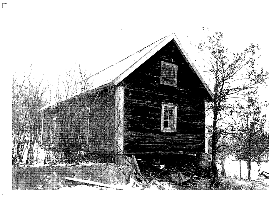
Neg. nr. T 09:21 Bod från NV