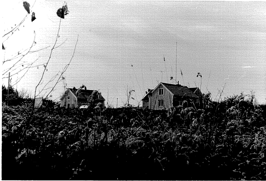
Neg. nr. T 04:12 Skrångstorp från 0

Ödeshög kommun Trehörna socken Skrångstorp 1:3