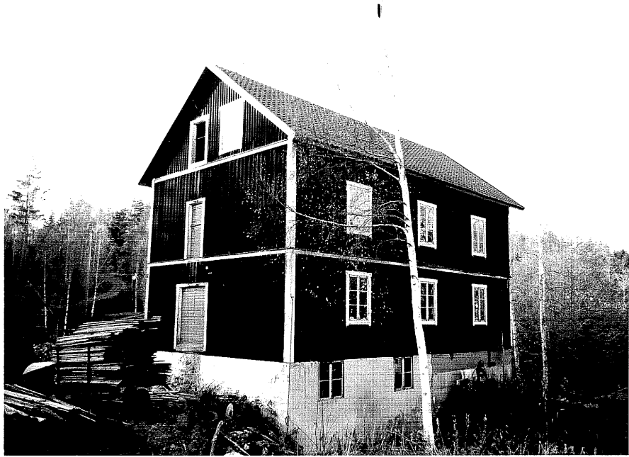
Neg. nr. T 03:30 Kvarnbyggnaden från SO

Ödeshög kommun Trehörna socken Slangeryd 1:11 Slangeryds brunn & kvarn