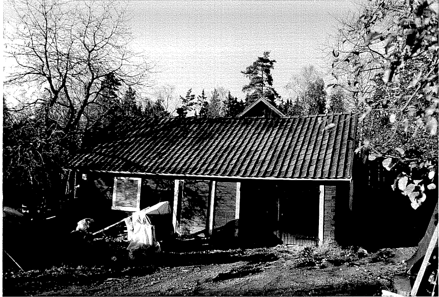
Neg. nr. T 03:33