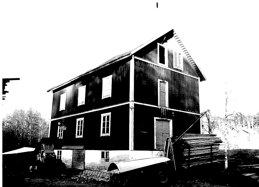
Neg. nr. T 03:31 Kvarnbyggnaden från SV