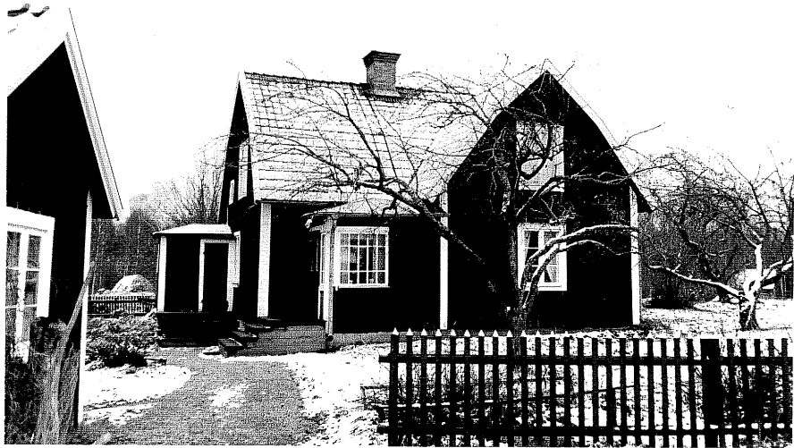
Neg. nr. T 10:26 Bråten från NV