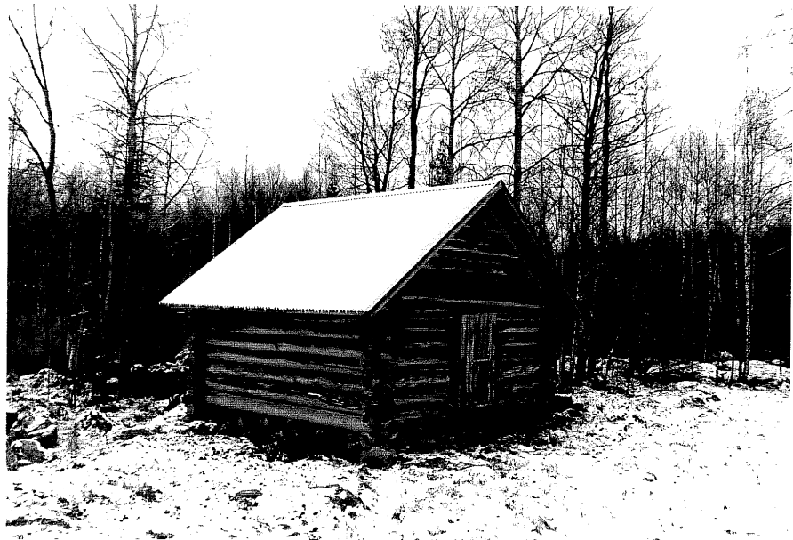
Neg. nr. T 10:27 Lada byggd med rännknutsteknik