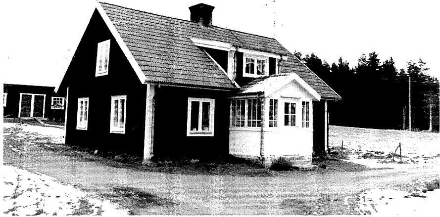
Neg. nr. T 10:19 Högekulla från SV

Ödeshögs kommun Trehörna socken Slangeryd 1:13 Högekulla