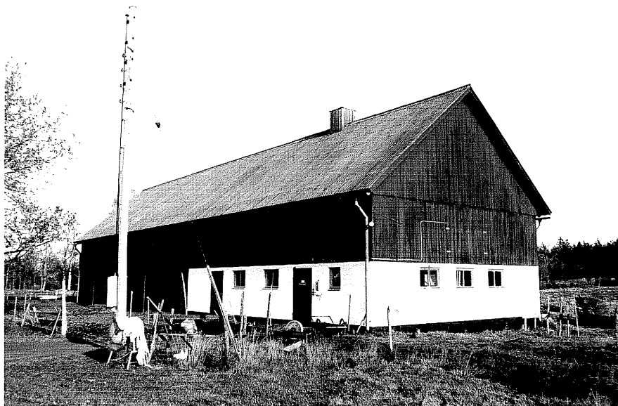
Neg. nr. T 04:35 Ladugården från SV

Ödeshög kommun Trehörna socken Lärkemålen 1:1 Lärkemålen