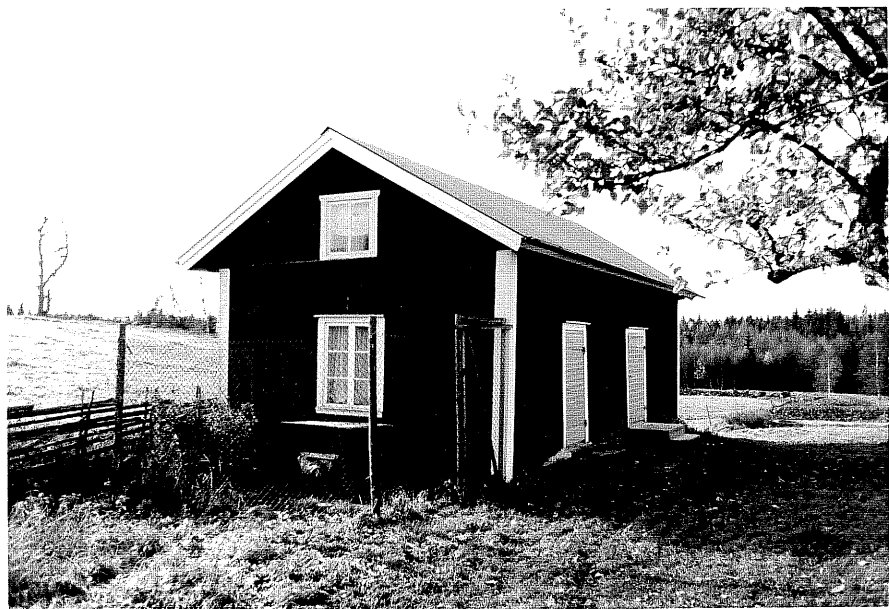
Neg nr T 04:33 Uthus från 80