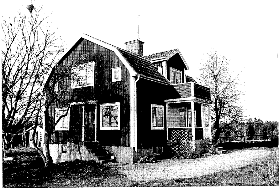
Neg. nr. T 04:32 Bostadshuset från 50

Ödeshög kommun Trehörna socken Lärkemålen 1:1 Lärkemålen