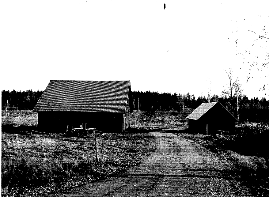
Neg. nr. T 04:36 Uthus från V, d till höger, e till vänster