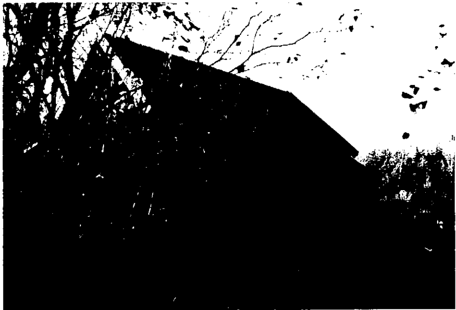
Neg. nr. T 03:25