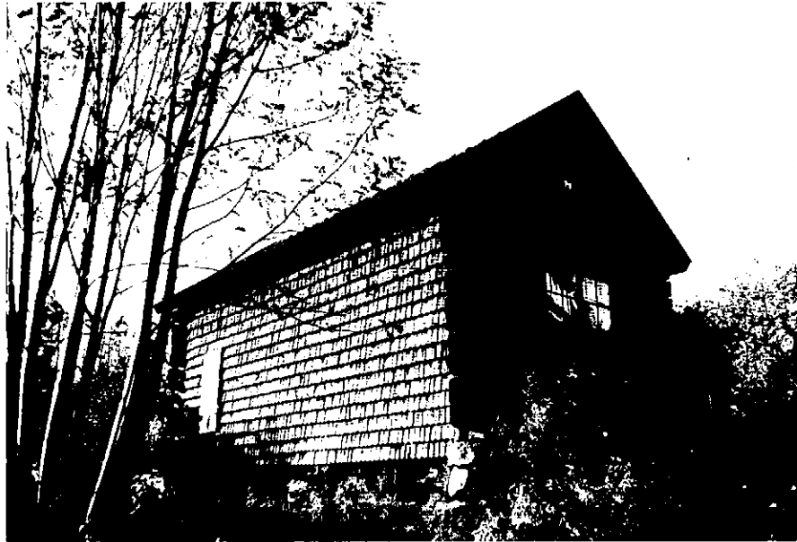
Neg. nr. T 03:27