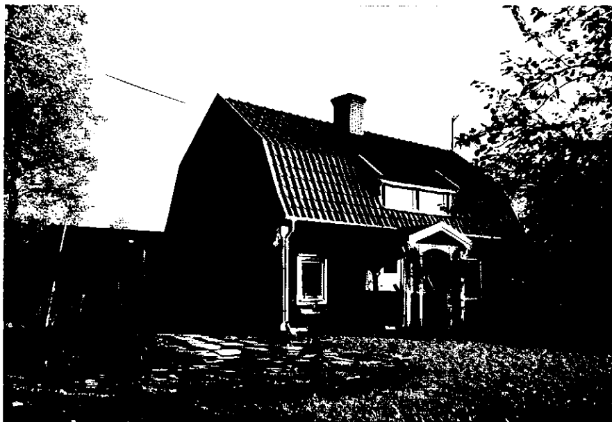
Neg. nr. T 03:24 Bostadshuset från NV

Ödeshög kommun Trehörna socken Slangeryd 1:5 Anderstorp