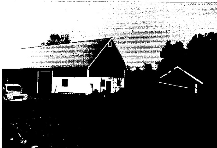
Neg. nr. T 03:28 Ladugården från SV