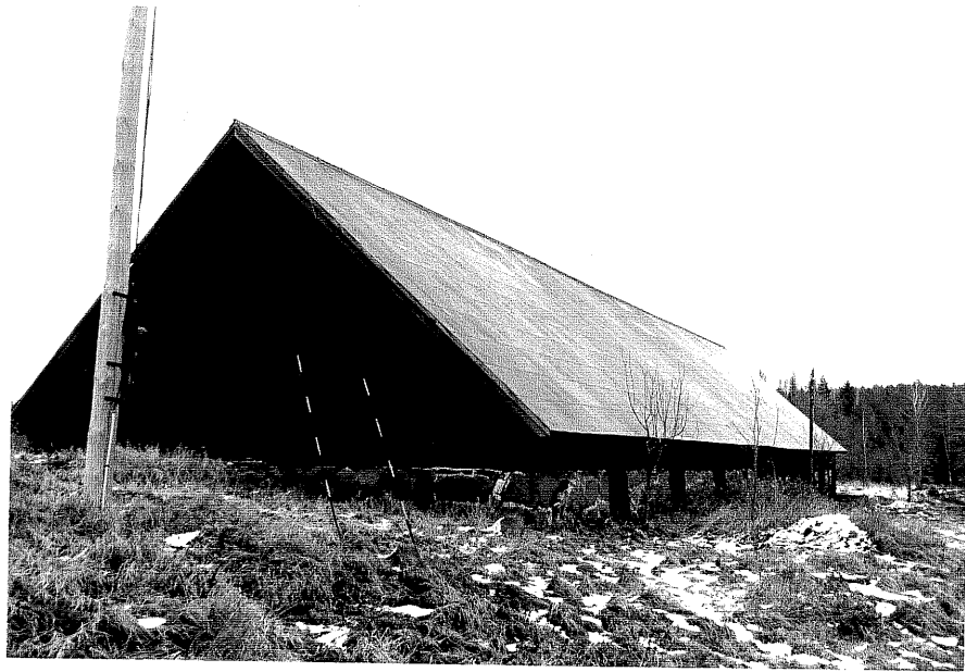
Neg. nr. T 10:23 Ladugård från SV