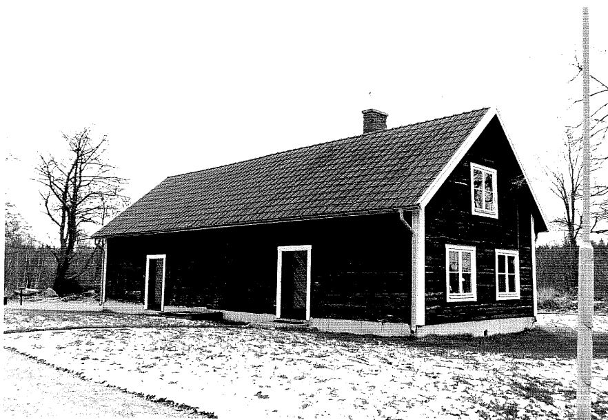
Neg. nr. T 10:22 Flygelbod från SV