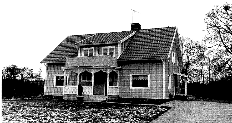
Neg. nr. T 10:21 Slangeryd från SO