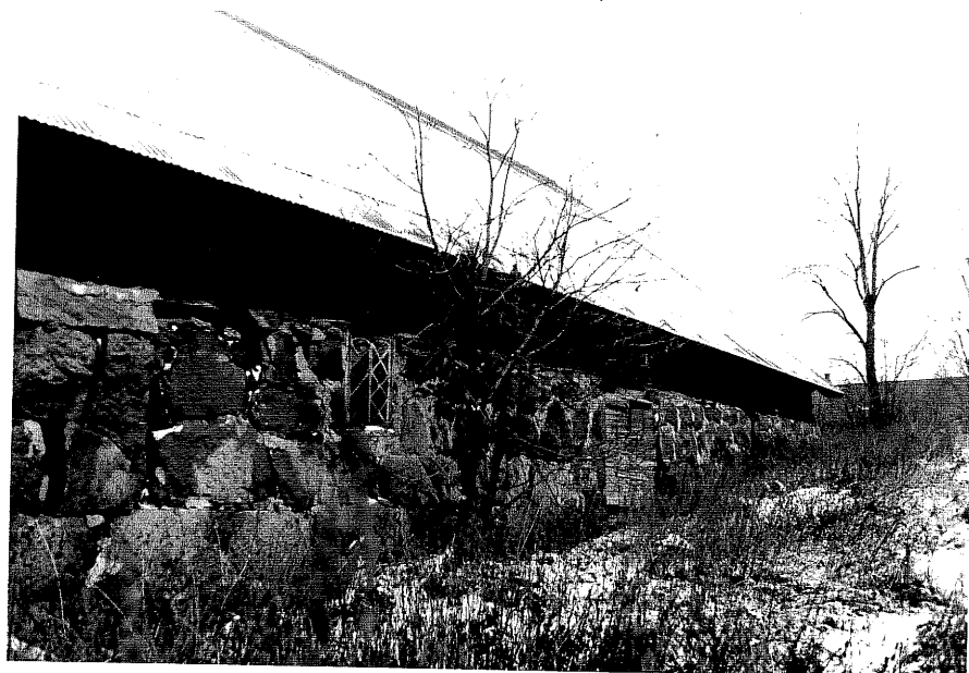
Neg. nr. T 10:25 Ladugård från NO