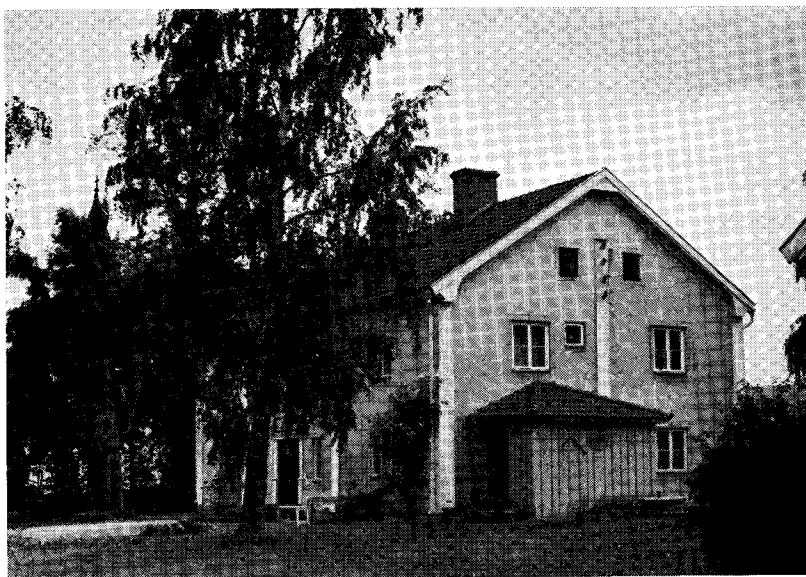
Berzelius' födelsegård i Väversunda.