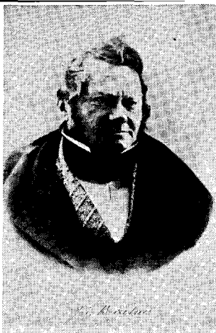
Detta foto av Berzelius torde ha tagits omkring 1845 genom den s. k. daguerrotypimetoden.