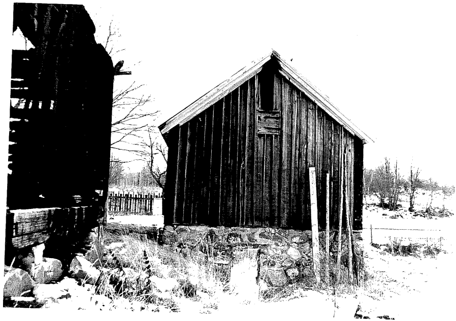
Neg. nr. T 12:31 Boden från V