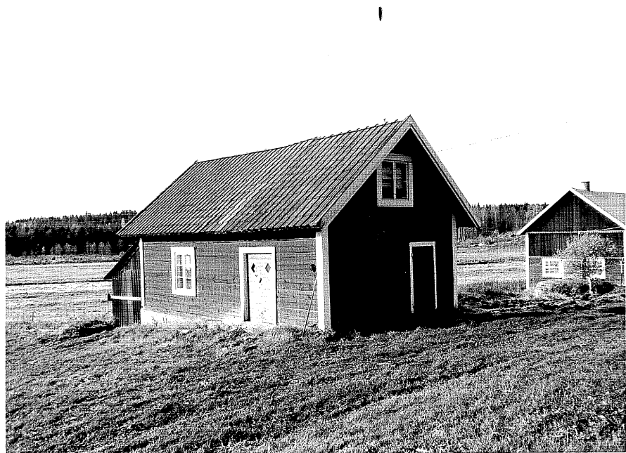
Neg. nr. T 04:15 Magasin från NO