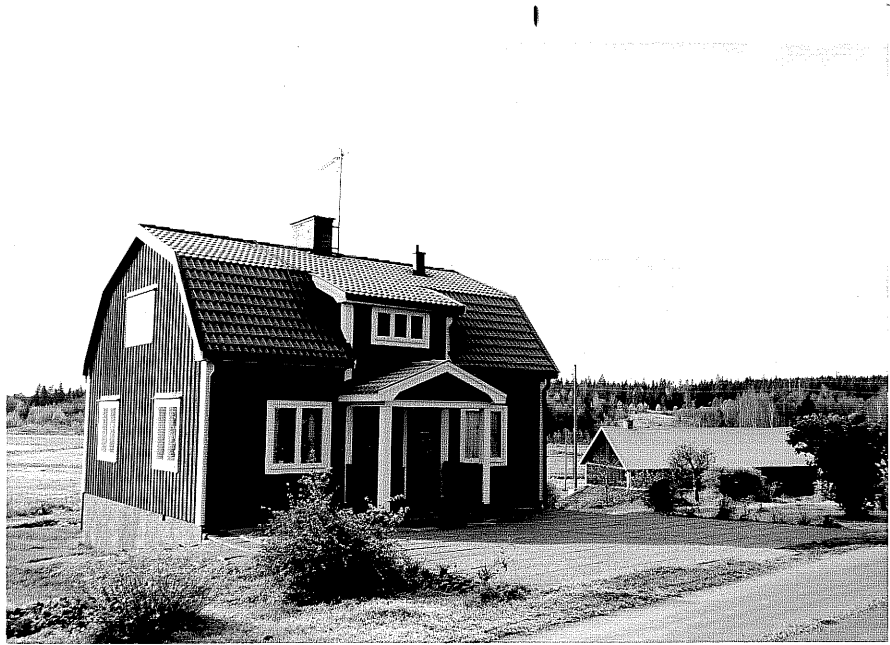
Neg. nr. T 04:13 Bostadshuset från N

Ödeshög kommun Trehörna socken Slättamossen 1:1 Slättamossen