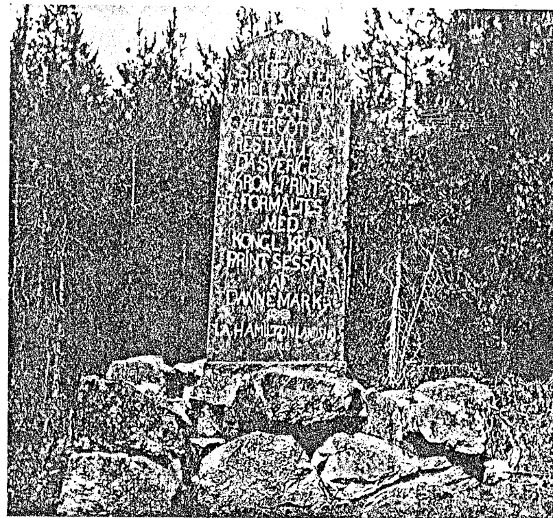
Fig. 2. Gränssten mellan Östergötland och Närke 1766.

årtal är också den nya typen av milstolpar försedda, vilka då uppsattes. De äro av kalksten och avslutas uppåt antingen runt eller spetsigt. Denna form varierar i allmänhet alltefter mittalen: 1 mil med spetsig avslutning, 1/2 mil uppåt rundad med två rundade intag och 1/4 milen rundad eller kanske oftare spetsig. Stenen mäter i regel 1,20 m. i höjd, vartill kommer en bas i jorden på c:a 0,50 m. Den står på ett fyrkantigt stort röse av bullersten, vilket i regel mäter 1,50 m. i fyrkant och 1 m. i höjd.