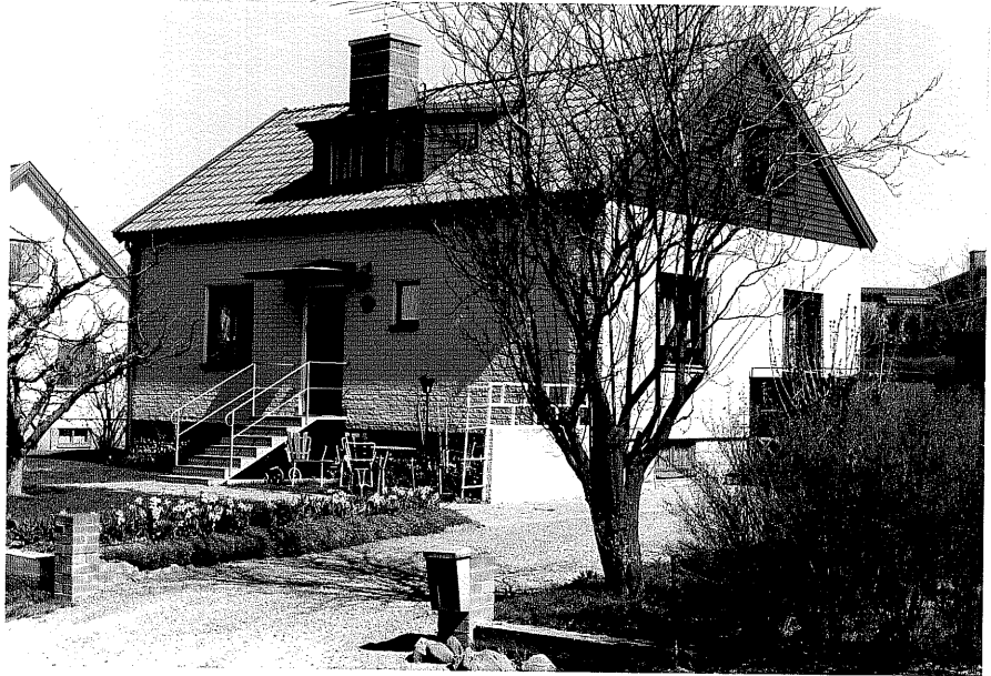
Bostadshus a fr.SV, 13:21.

Ödeshög sn Snoken 10 Vadstenavägen 10 foto:M.Wikdahl,1978