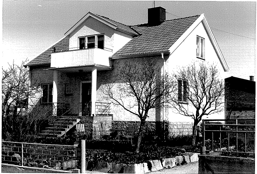
Bostadshus fr,SV, 13:26.

Ödeshög sn Snoken 6 Vadstenavägen 18 foto:M.Wikdahl,1978.