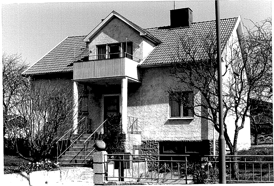
Bostadshus fr.SV, 13:25.