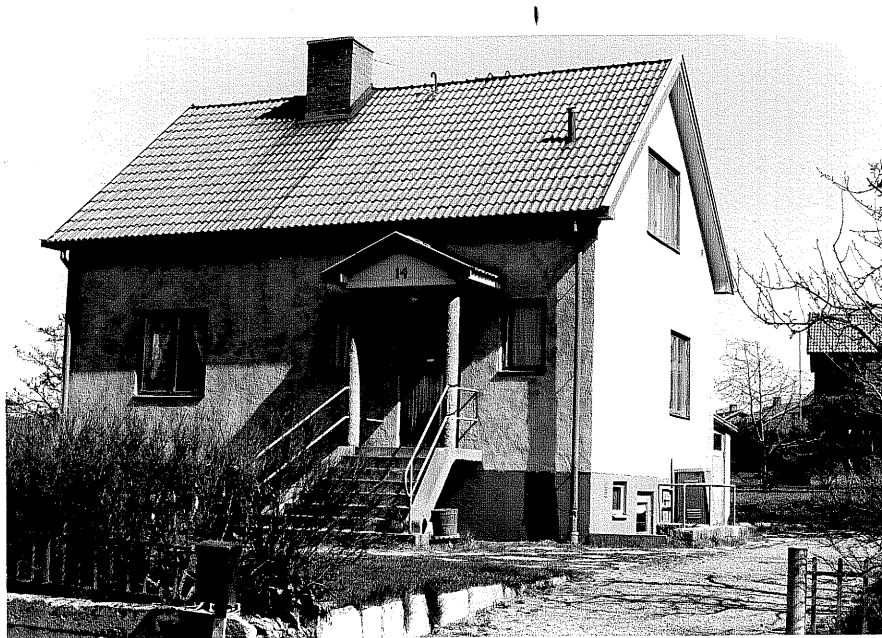
Bostadshus fr,SV, 13:24.