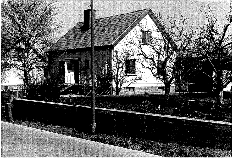
Bostadshus a fr.SV, 13:22.

Ödeshög sn Snoken 9 Vadstenavägen 12 foto:M.Wikdahl,1978.