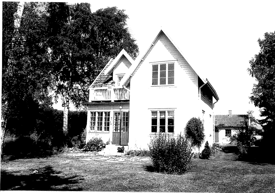
Neg. nr. V.T 06:15 Bostadshuset mot söder

Ödeshögs kommun V:a Tollstad socken Soldalen 1 1