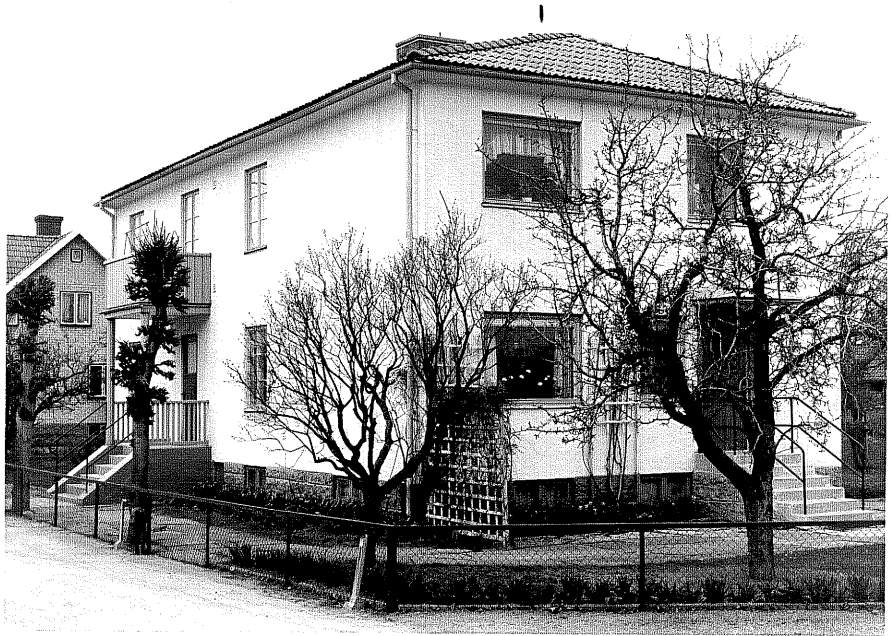
Bostadshus fr.S, 9:16.

Ödeshög sn Stenbocken 1 Högmobergagatan 5 foto:M.Wikdahl,1978.