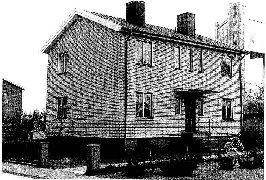
Bostadshus ifr.N, 10:5.

Ödeshög sn Stenbocken 6 Vattugatan 5 foto:M.Wikdahl, 1978.