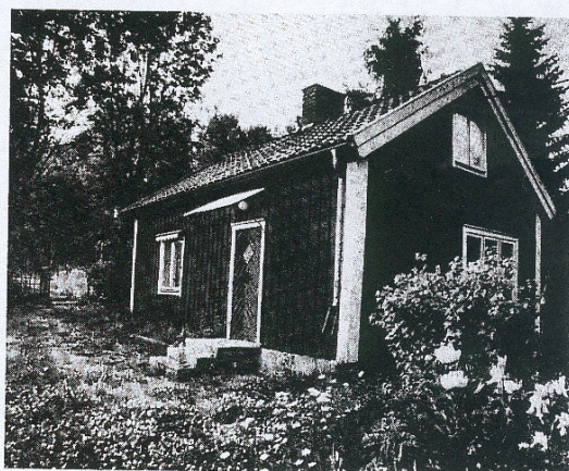
Grenadjärortorp Sand 1988. Friköptes och blev eget småbruk 1909. Torpet kunde föda två kor och gris, på åkerlapparna odlades säd och potatis