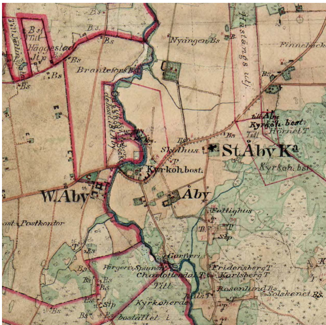
Utdrag ur häradsekononisk karta 1868-1877, blad Åby