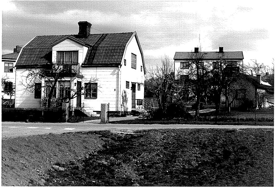
Bostadshus a fr.V, 8:11.

Ödeshög sn Strykjärnet 1 Vadstenavägen 8 foto:M.Wikdahl,1978.