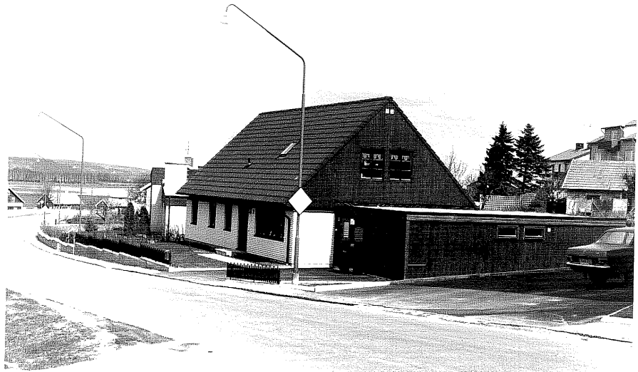
Bostadshus fr.S, 7:36.

Ödeshög sn Strykjärnet 11 Vadstenavägen foto:M.Wikdahl,1978.