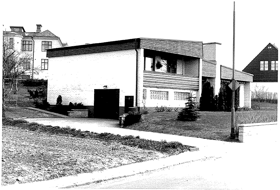
Bostadshus fr, N, 8:9.

Ödeshög sn Strykjärnet 7 Vadstenavägen foto: M. Wikdahl, 1978.