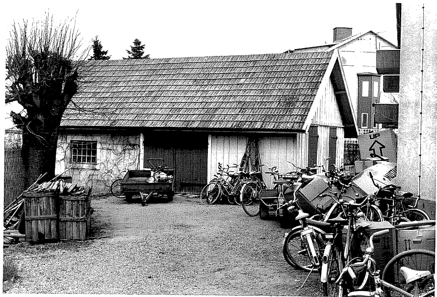
Uthus b fr,V, 8:4.