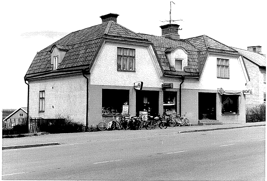
Affärs och bsoadshus fr.S, 8:3.

Ödeshög sn Strykjärnet 9 Storgatan foto:M.Wikdahl,1978.