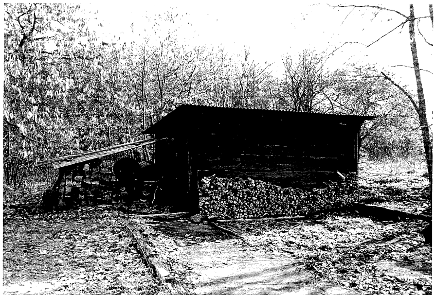
Neg. nr. T 04:20