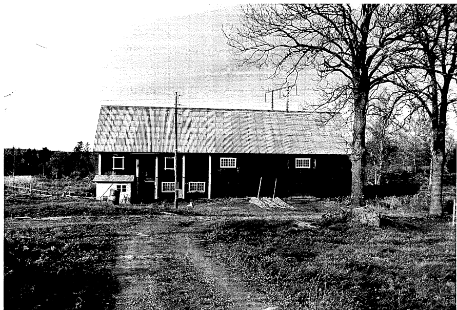
Neg. nr. T 04:27