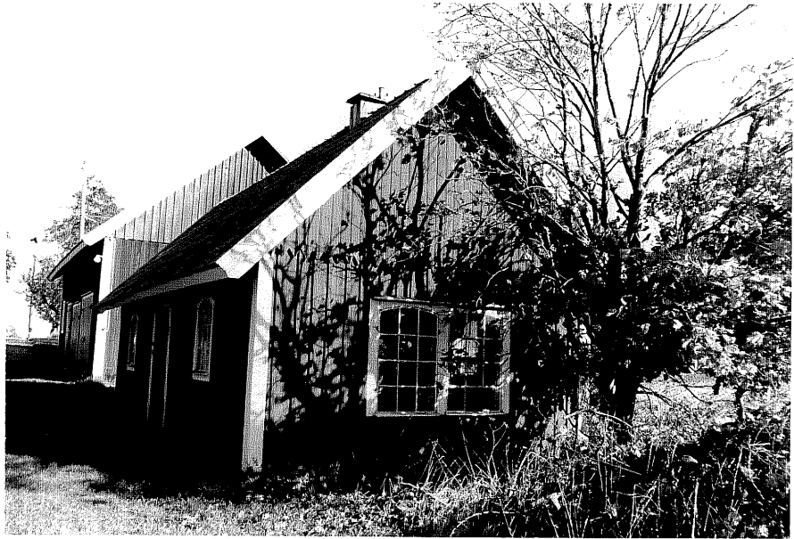
Neg nr ÖKM 08:03 Uthus från S Byggnad e

Ödeshögs kommun Svanshals socken Svanshals Toregård 3:4