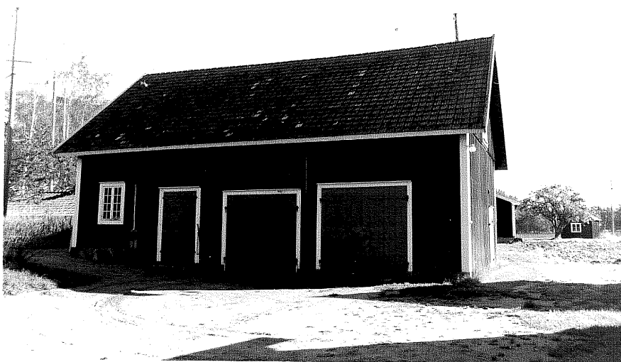
Neg nr ÖKM 08:05 Magasin, garage frånV Byggnad d