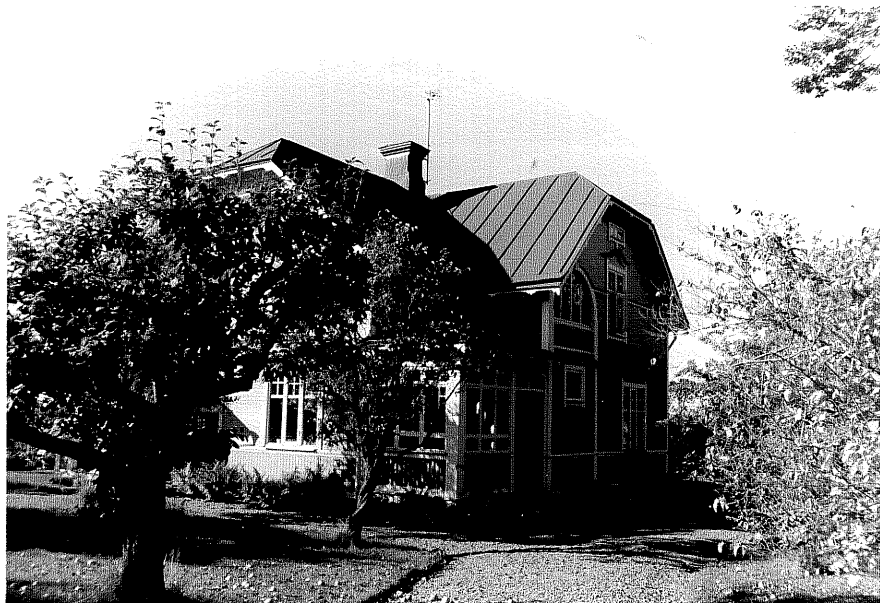
Neg nr ÖKM 08:14 Bostadshus från NO Byggnad a

Ödeshögs kommun Svanshals socken Svanshals Toregård 3:4