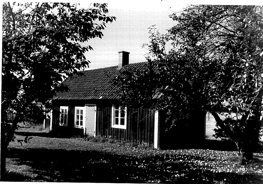
Neg nr ÖKM 08:11 Uthus, gäststuga från NO byggnad b