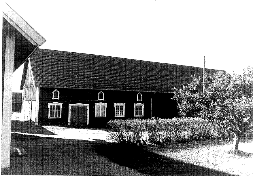
Neg nr ÖKM 08:09 Ladugård från N Byggnad c

Ödeshögs kommun Svanshals socken Svanshals Toregård 3:4