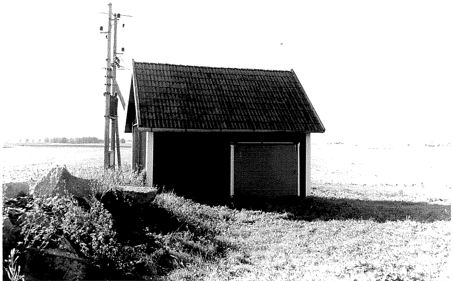
Neg nr ÖKM 08:01 Uthus från N byggnad f