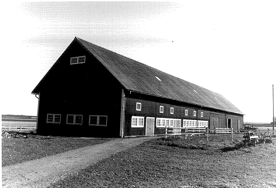
Neg.nr ÖKM 07:25 Ladugård, loge från SV Byggnad b