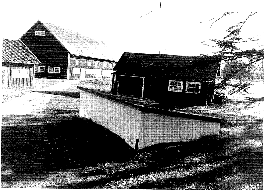
Neg.nr ÖKM 07:28 Gårdsmiljö med pumphus från SV Byggnad h