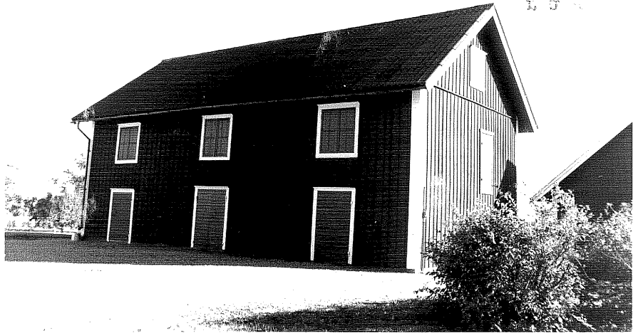
Neg.nr ÖKM 07:19 Magasin från SV Byggnad c

Ödeshögs kommun Svanshals socken Svanshals 6:1 Löneboställe