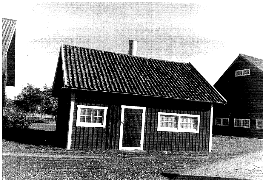
Neg.nr ÖKM 07:22 Hönshus från S Byggnad e

Ödeshögs kommun Svanshals socken Svanshals 6:1 Löneboställe