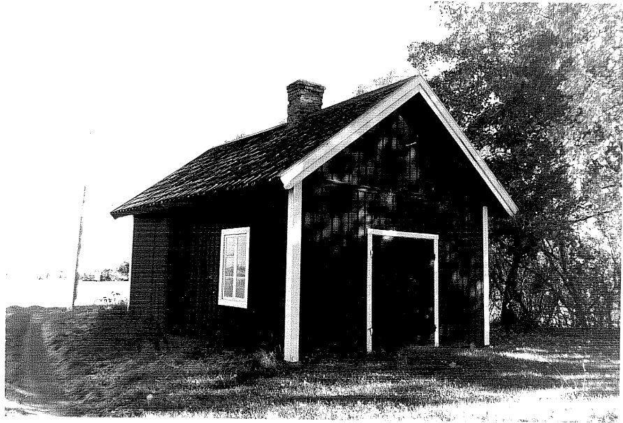
Neg.nr ÖKM 07:35 Tvättstuga från S Byggnad g

Ödeshögs kommun Svanshals socken Svanshals 6:1 Löneboställe