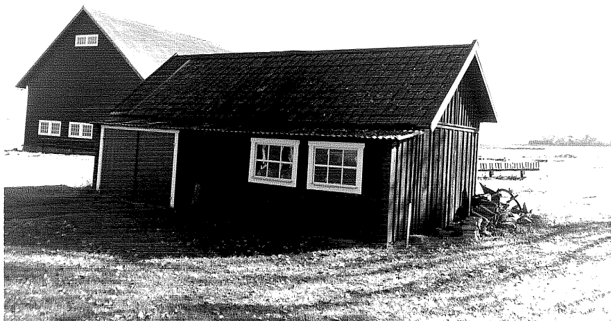
Neg.nr ÖKM 07:26 Garage, verkstad från V Byggnad f