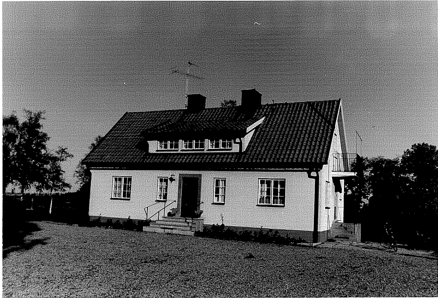
Neg.nr ÖKM 07:17 Bostadshus från SO Byggnad a

Ödeshögs kommun Svanshals socken Svanshals 6:1 Löneboställe