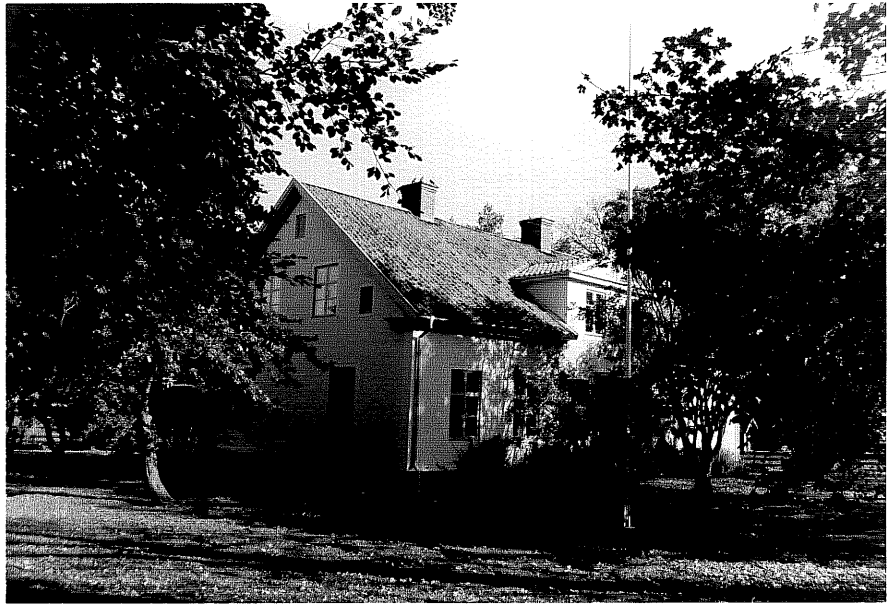
Neg nr ÖKM 08:28 Byggnaden från SV